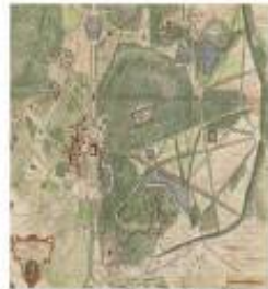
Meudon, les jardins au XVIII e siècle D'après le plan de Nicolas de Fer, 1706

Publié deux ou trois fois par an, le bulletin présente des articles de référence, sur le patrimoine exceptionnel de Meudon. Il aborde les divers enjeux de l'urbanisme, les spécificités environnementales, artistiques scientifiques et géologiques de notre ville à travers les activités de ses habitants. Tous les numéros sont disponibles sur notre site internet :