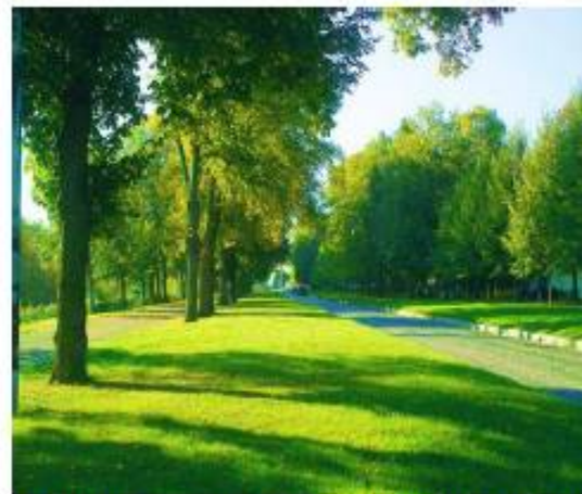
Une partie de la Perspective Nord (avenue du Château)