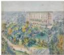
La villa de Bellevue - aperçu du projet de l'architecte de Pavillon de Bellevue, Henri Matisse musée d'Orsay